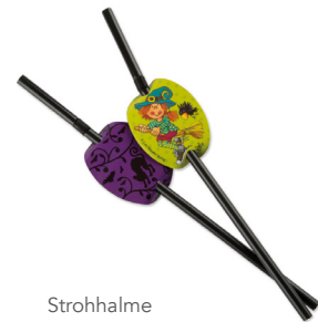
Strohhalme Lutz Mauder Verlag