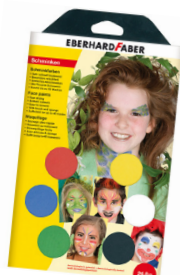
Schminke Eberhard Faber