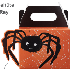
Mitgebseltüte Ginger Ray