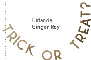
Girlande Ginger Ray